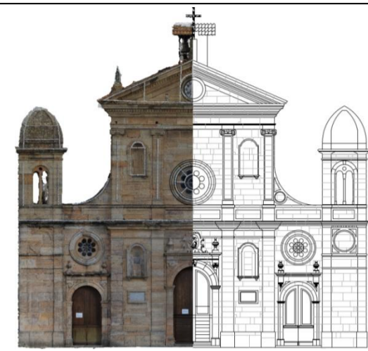
TAVOLA N° 3 a

PROGETTO PER I LAVORI DI RESTAURO E CONSOLIDAMENTO DELLA FACCIATA IN PIETRA CALCARENITICA DEL SANTUARIO DI SANTA LIBERATA V.M.