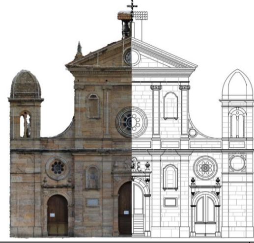
TAVOLA N° 6 b

PROGETTO PER I LAVORI DI RESTAURO E CONSOLIDAMENTO DELLA FACCIATA IN PIETRA CALCARENITICA DEL SANTUARIO DI SANTA LIBERATA V.M.